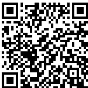
SportsLists LITE mobile App. Available for iOS and Android

Eine Veröffentlichung der vorläufigen Meldeliste (mit bezahlten Meldungen) erfolgt jeweils 24 Stunden nach Online-Meldeschluss auf https://sportslists.eu/results/select/live